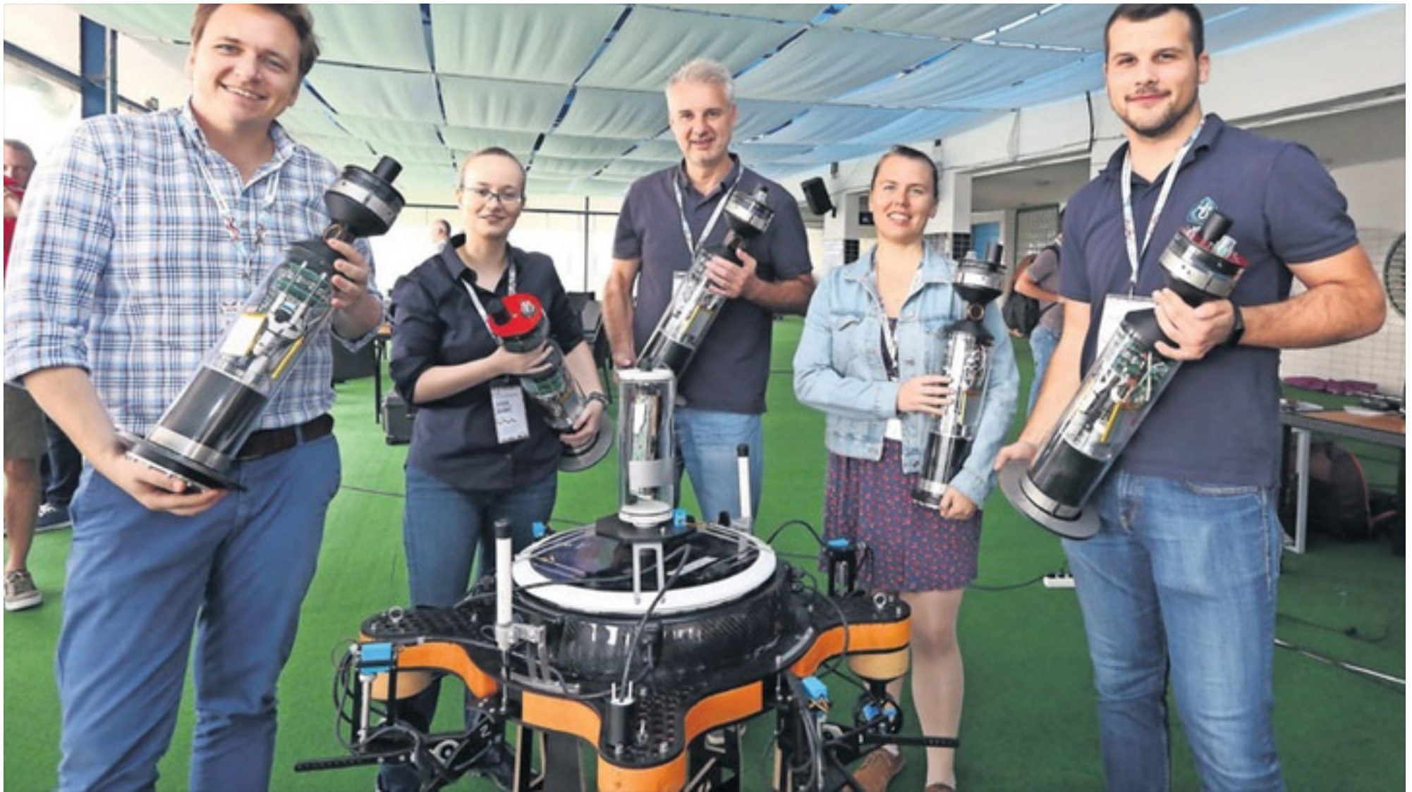
📷 Dio eksperata iz laboratorija LAPOST na demonstraciji u Biogradu/Duško Jaramaz/PIXSELL